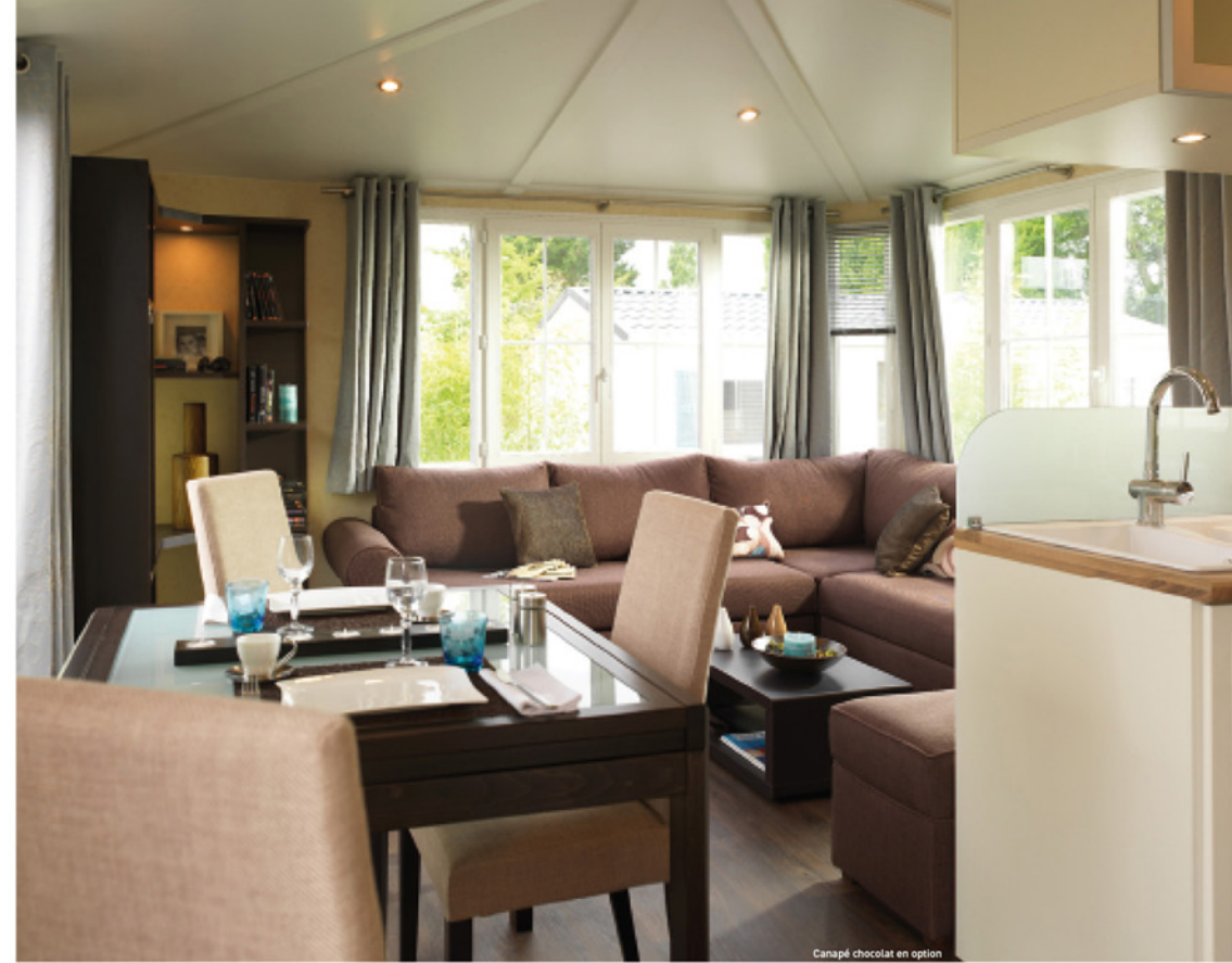
Canapé chocolat en option