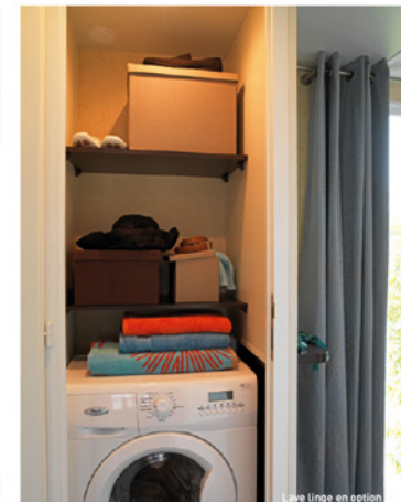
Lave linge en option